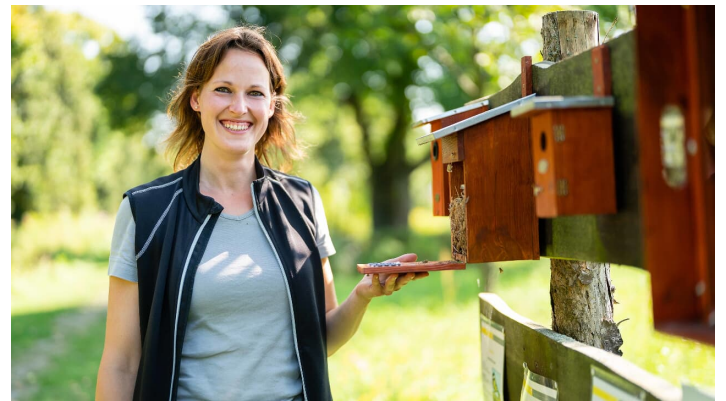
Nistkastenwand heimischer Vogelfamilien