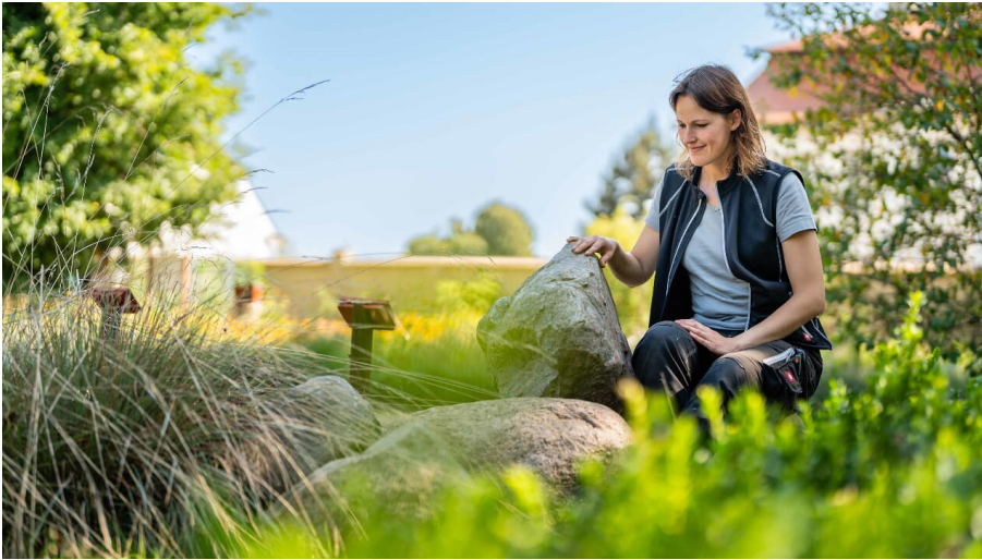
beliebte Natur- und Umweltstätte