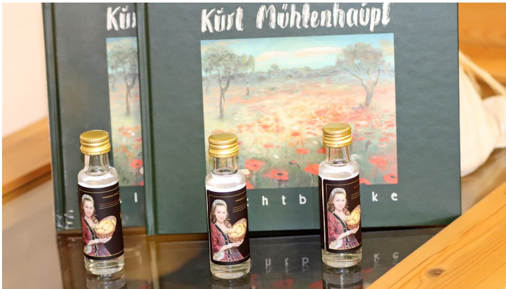
Kartoffelschnaps und Mühlenhaupt