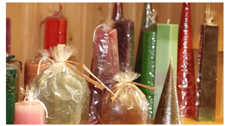
Kerzen - © TKO gGmbH, Lizenz: TKO gGmbH