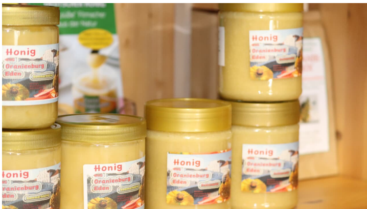
Honig der Schlossparkbienen