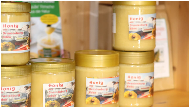
Honig der Schlossparkbienen