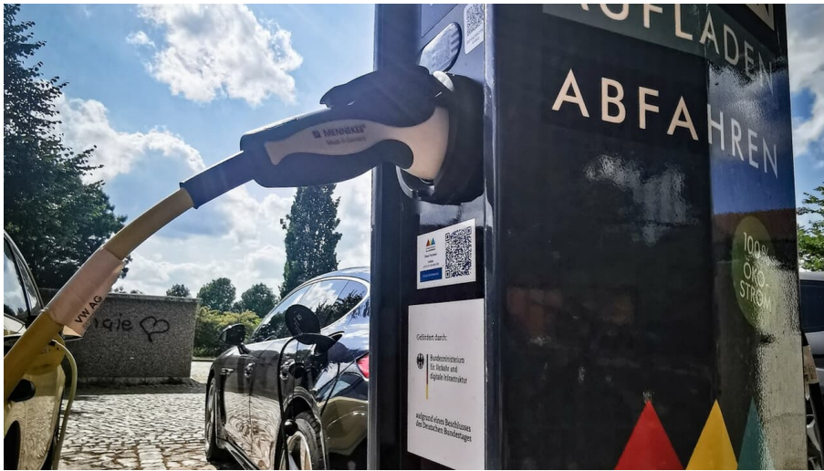
E-Ladesäule Stadtwerke Oranienburg GmbH