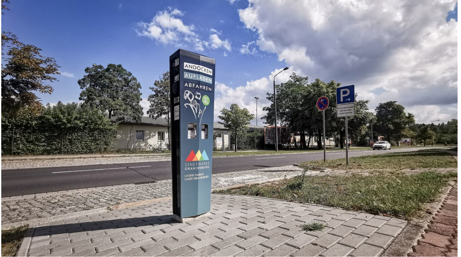
E-Ladesäule an der TURMErlebniscity