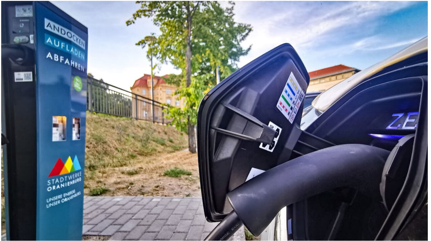
E-Ladesäule auf dem Fischerparkplatz