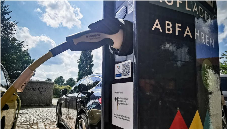
E-Ladesäule Stadtwerke Oranienburg