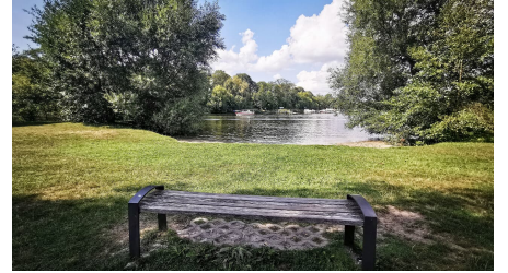
Blick auf den Badestrand "Boll"