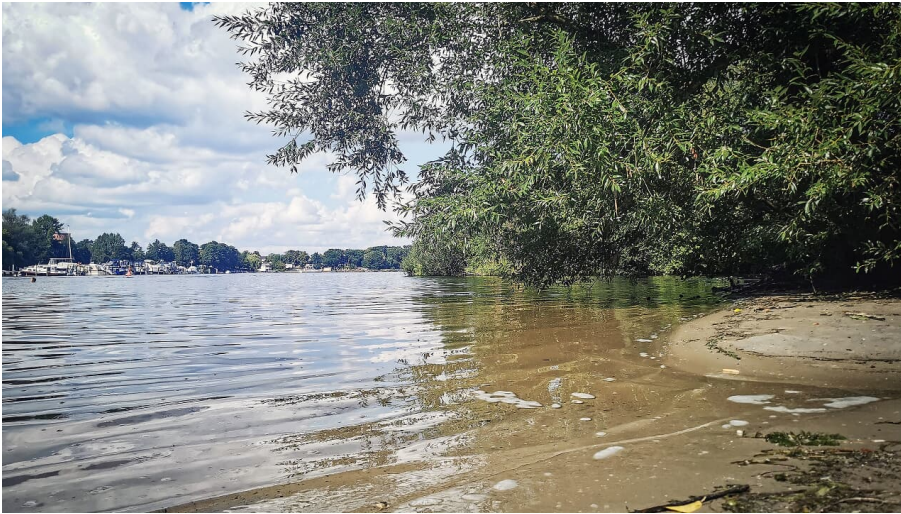
Badestelle "Bolli" am Lehnitzsee