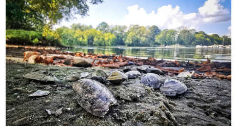
Strand am "Boll"