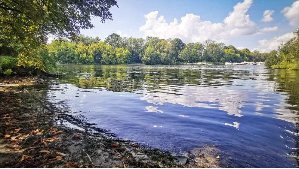
Wasser an der Badestelle "Boll" am Lehnitzsee