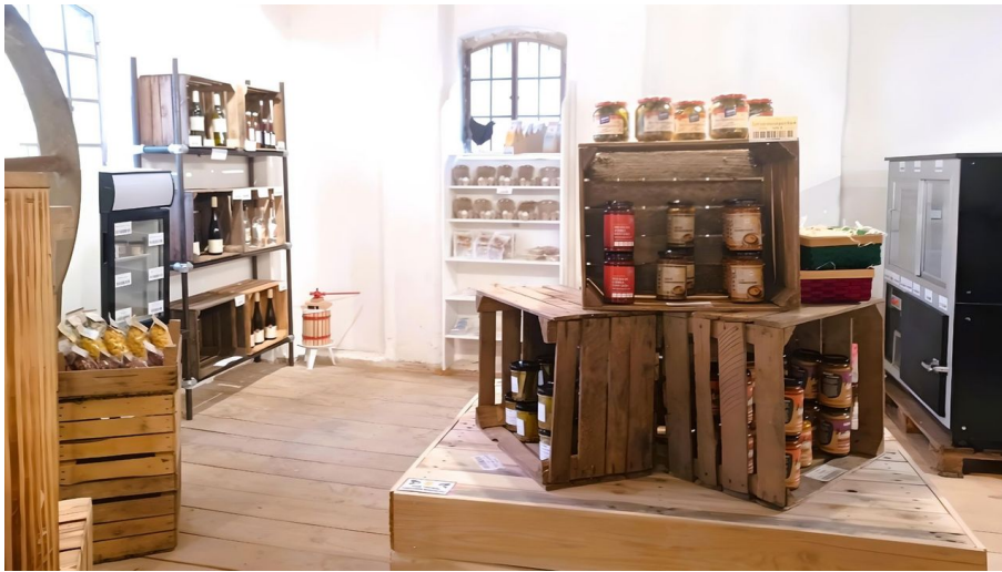
Hofladen Mühlenclub