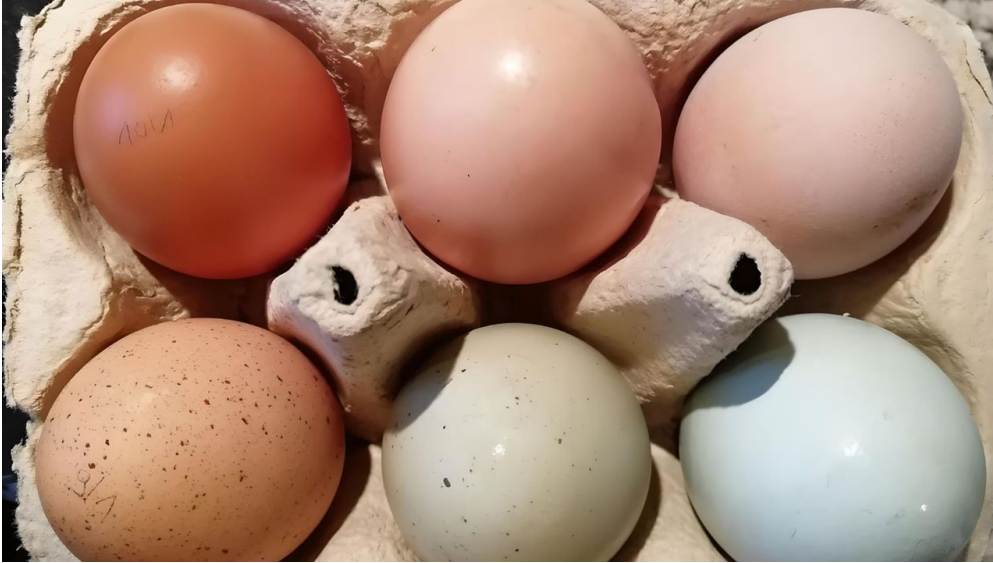
Frische Eier - © Hofladen Mühlenclub