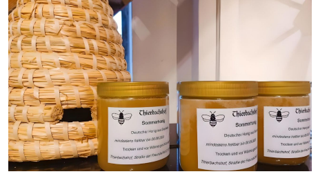
Honig vom Tierbachshof