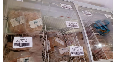
Tiefkühlwaren im Mühlenclub