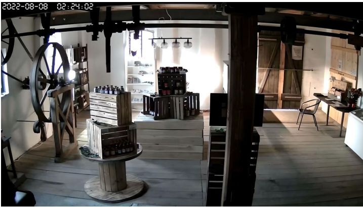
Hofladen Mühlenclub