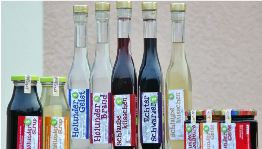
Holunderkönig in Groß Muckrow bei Friedland - © Schulze