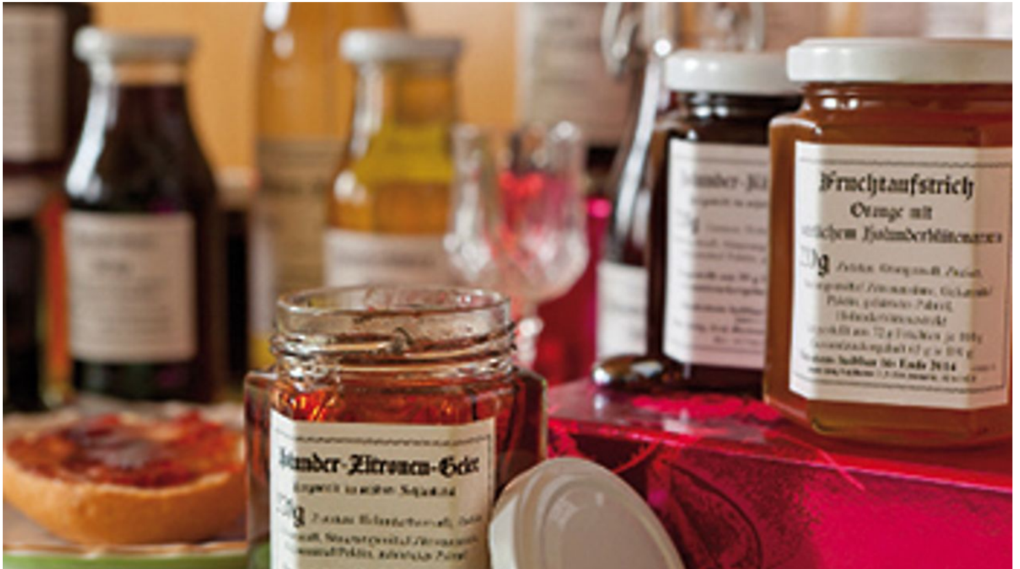
Holunderkönig in Groß Muckrow bei Friedland