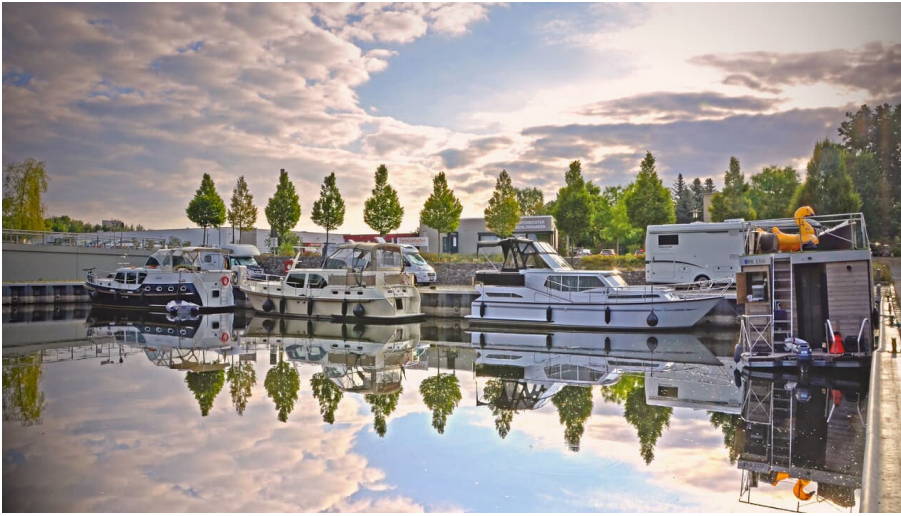
Schlosshafen Oranienburg