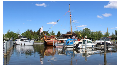
Schlosshafen Oranienburg