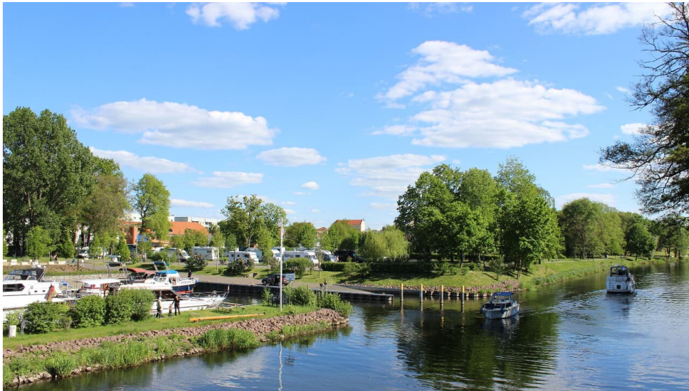
Servicehafen des Schlosshafens Oranienburg an der Havel