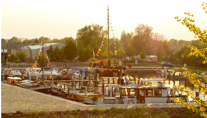
Schlosshafen Oranienburg