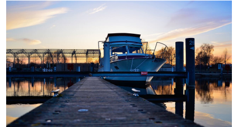
Schlosshafen im Abendlicht