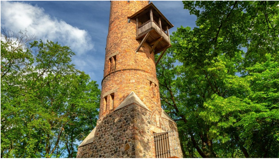
Bismarckturm - © Seenland Oder-Spree e.V./Florian Läufer