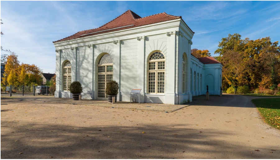
Orangerie im Herbst