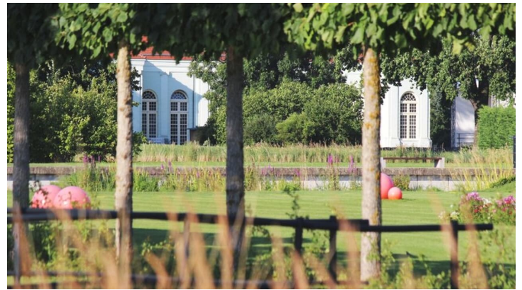
Blick auf Orangerie