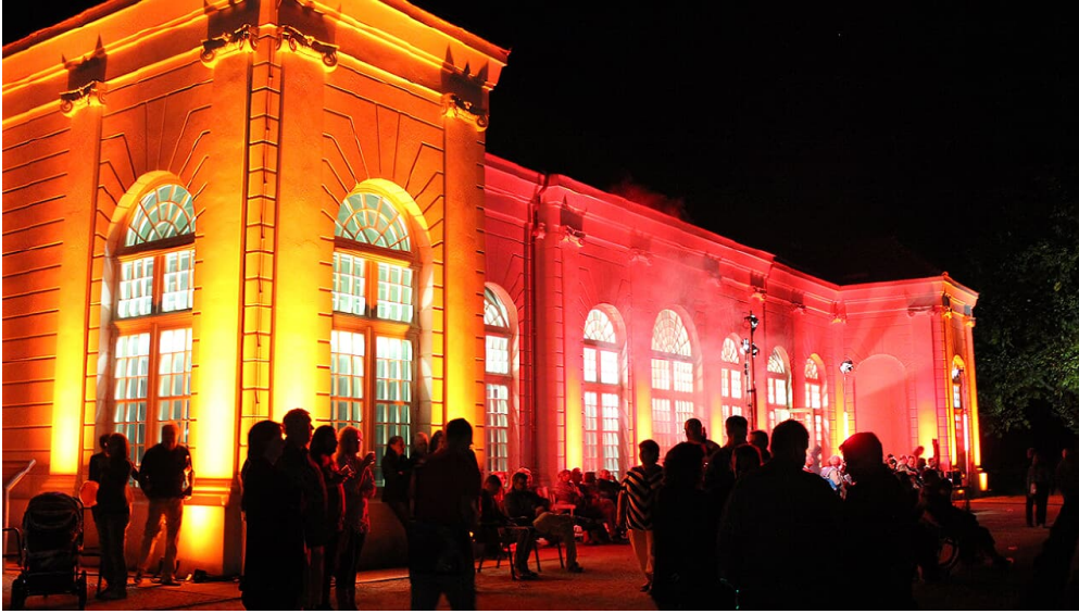
Orangerie bei Veranstaltungen