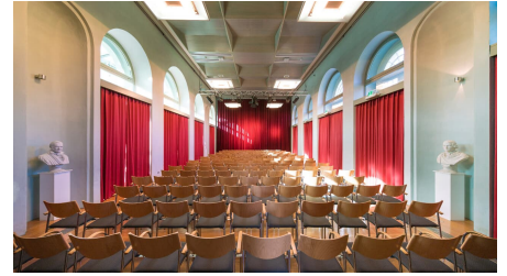
Orangerie Saal