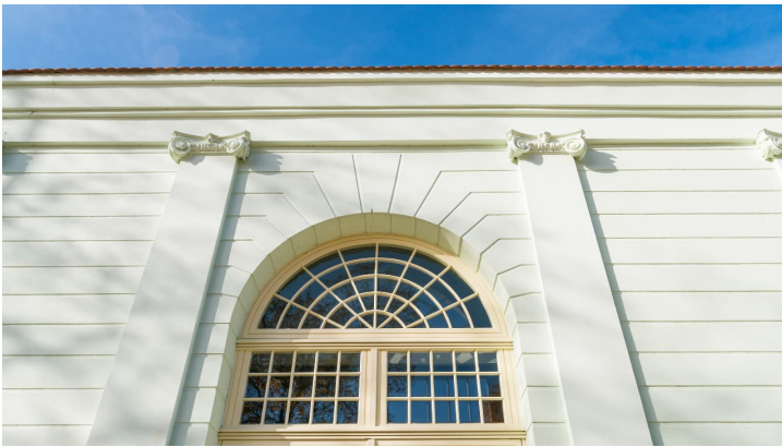
Orangerie Außenansicht