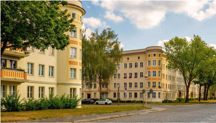
Wohnkomplex II, Runderkerblöcke