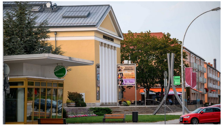
Friedrich-Wolf-Theater in der Lindenallee Eisenhüttenstadt