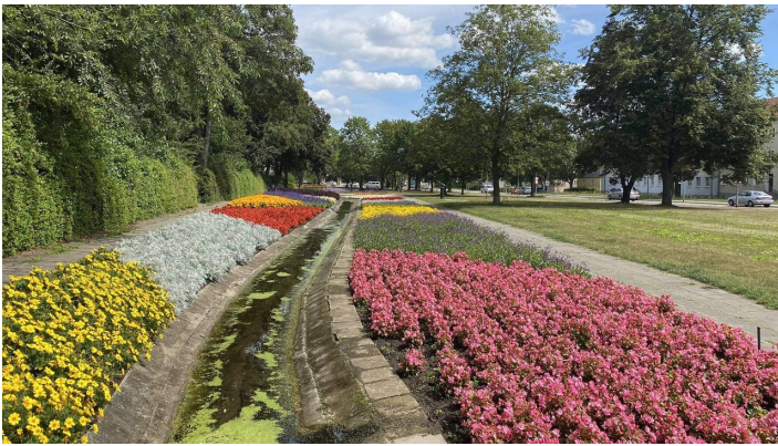
Gartenfließ im Sommer