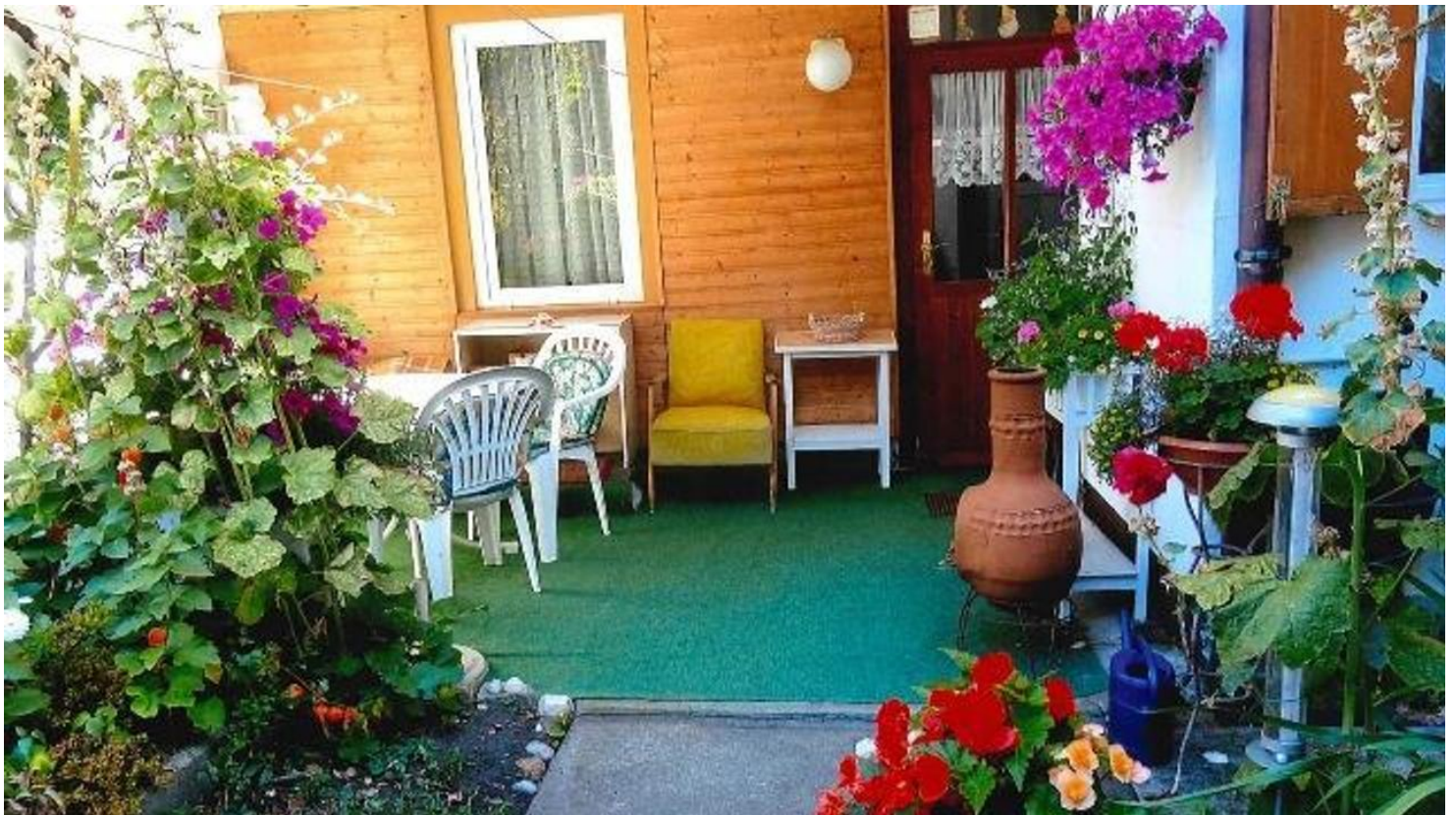
Sitzplatz im Hof