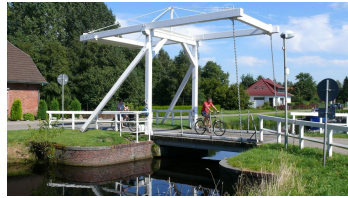
Klappbrücke in Ostrhaudefehn