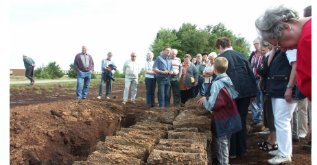
Ausflug ins Moor