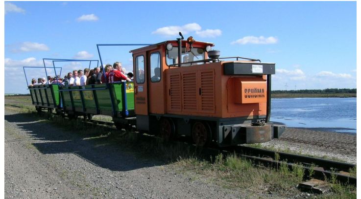
Moorbahn "Seelter Foonkieker"