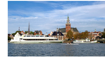
Oliver Knagge, Ostfriesland Tourismus