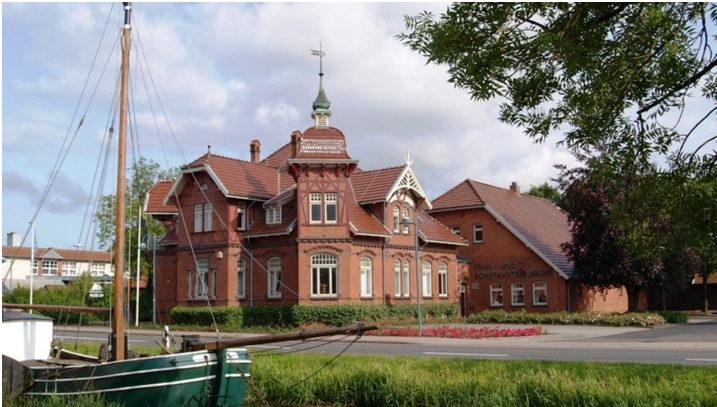
Fehn- und Schifffahrtsmuseum - © Ostfriesland Tourismus