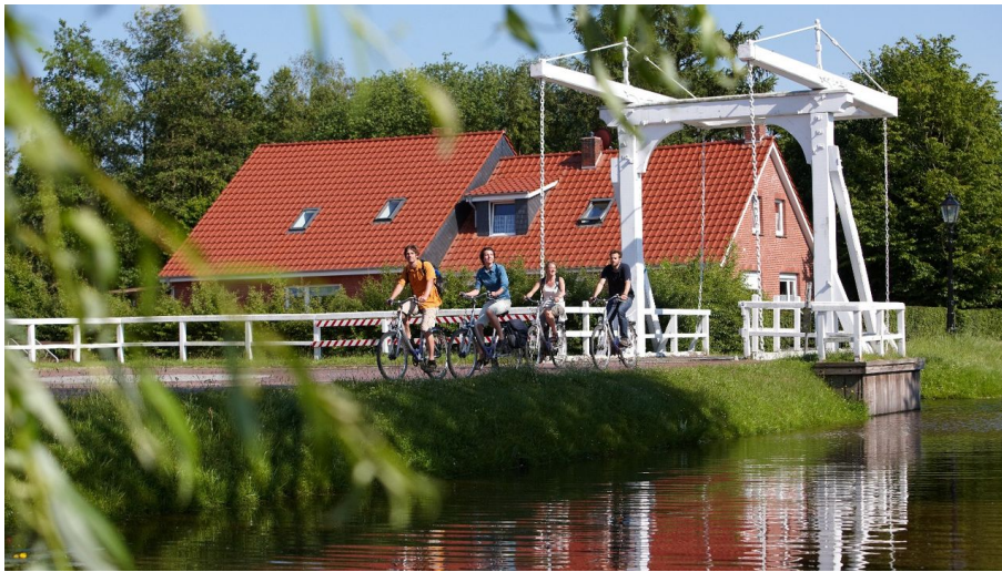
Radfahrer auf Klappbrücke in Papenburg