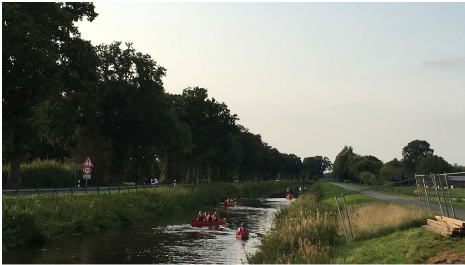
Kanufahrer auf dem Nordloher Kanal