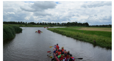
Kanu Konvoi