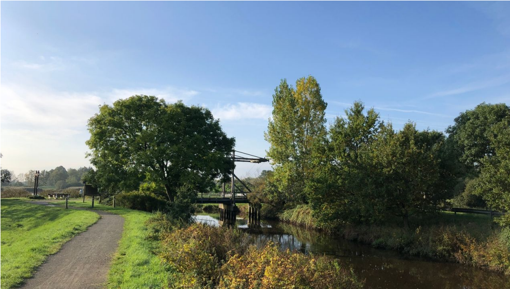
Ende des Augustfehnkanals