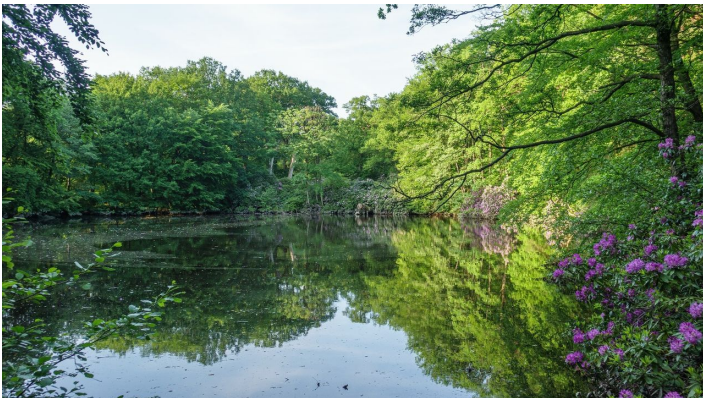
Ellernteich im Schlosspark