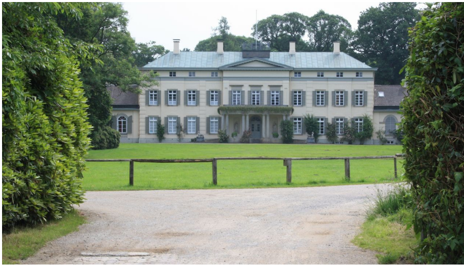
Das Rasteder Schloss