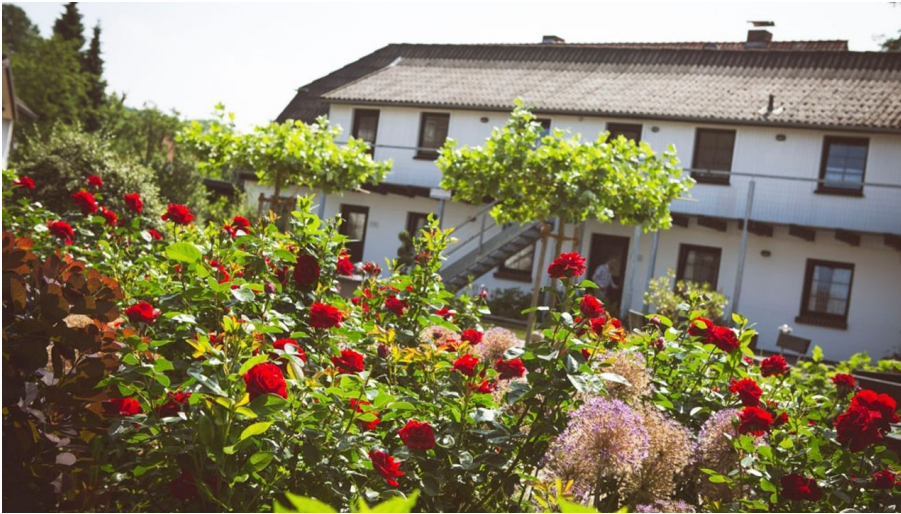
Landhotel Belitz