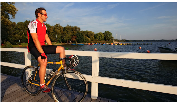
Pause am Zwischenahner Meer