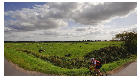
Durch die Fehnlandschaft in Richtung Leer