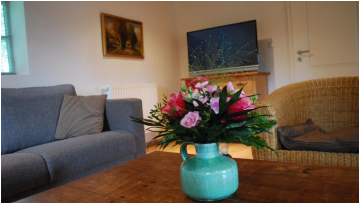
Wohnzimmer TV Ecke