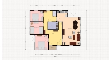
Grundriss Ferienhaus Unter Eichen