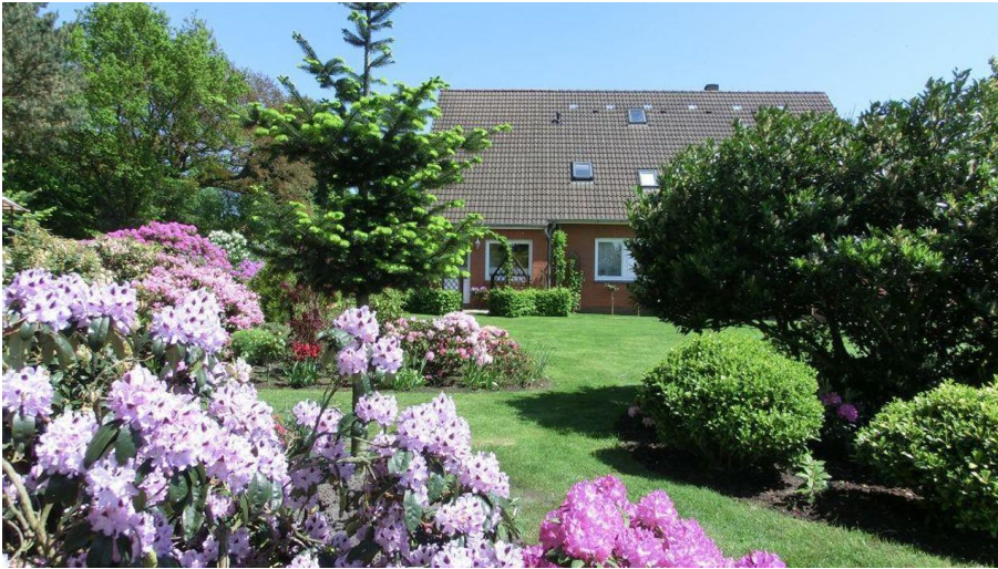
Impressionen - © Elfriede Meyer