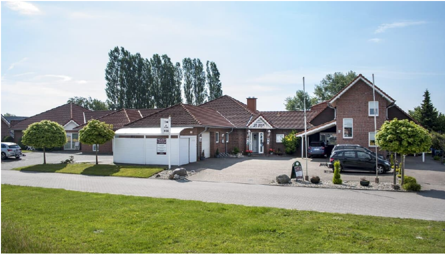
Außenansicht Eingangsbereich