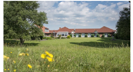
Außenansicht Garten