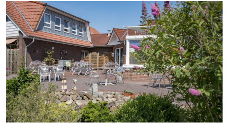
Wintergarten