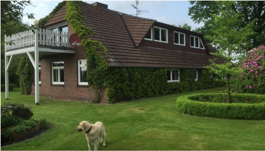
Ansicht vom Garten