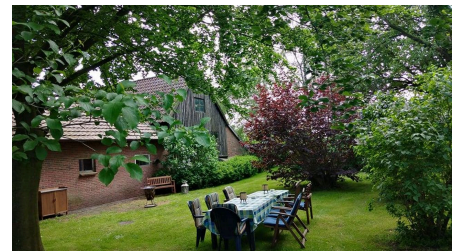
Sitzecke im Garten