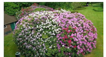
Rhodos im Garten 2