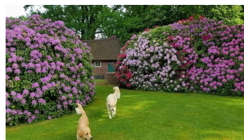
Rhodos im Garten