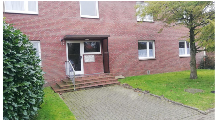
Eingang hinterm Haus