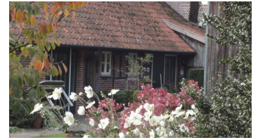
Haustüren beider Ferienwohnungen