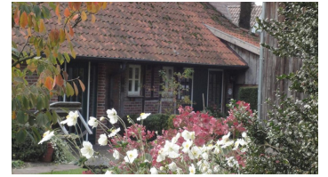
Haustüren beider Ferienwohnungen