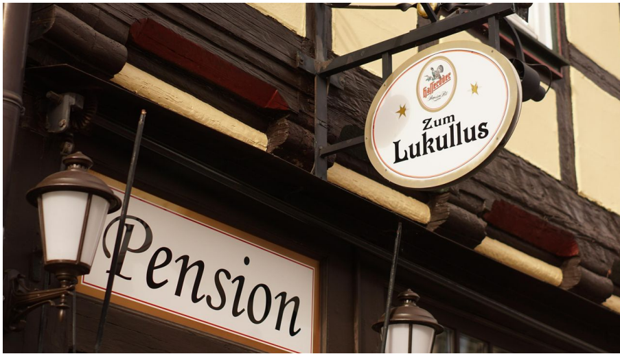
Pension Zum Lukullus