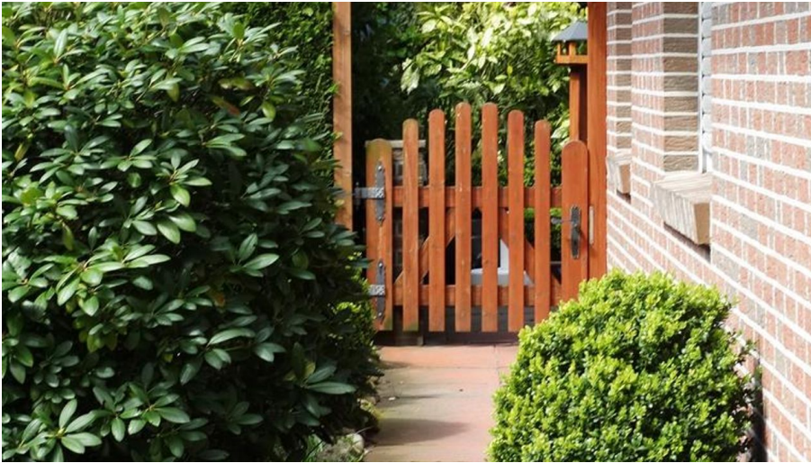
Teilsicht auf den Autostellplatz