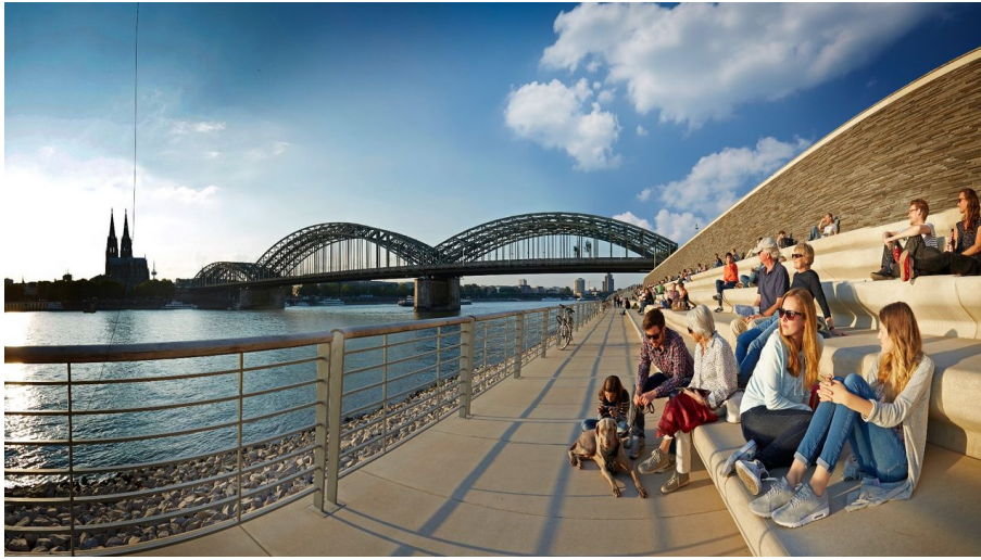
Axel Schulten - Axel Schulten