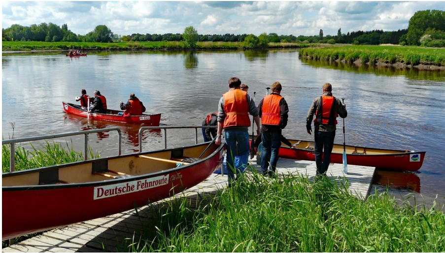
Kanufahrer starten in Stickhausen