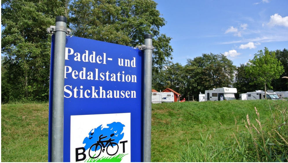
Paddel-und-Pedalstation Stickhausen