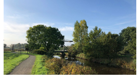
Ende des Augustfehnkanals - © Arno Ewen, Touristik GmbH Südliches Ostfriesland