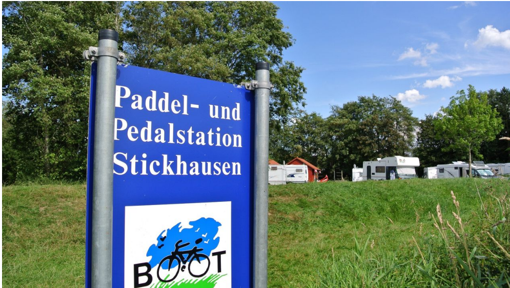
Paddel-und-Pedalstation Stickenhausen