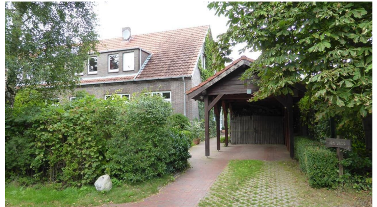
Kfz-Stellplatz, Carport und Zugang zu Grundstück