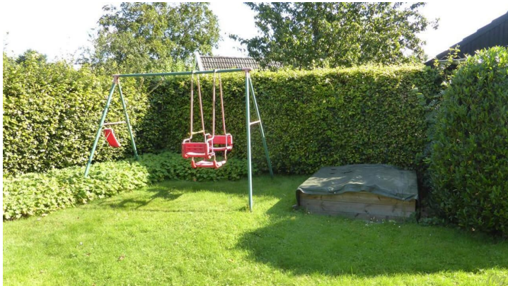
Garten Spielgeräte