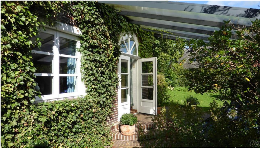
Seiteneingang von der Terrasse