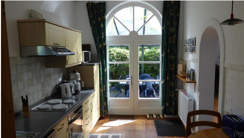
Küche und Ausgang zur Terrasse