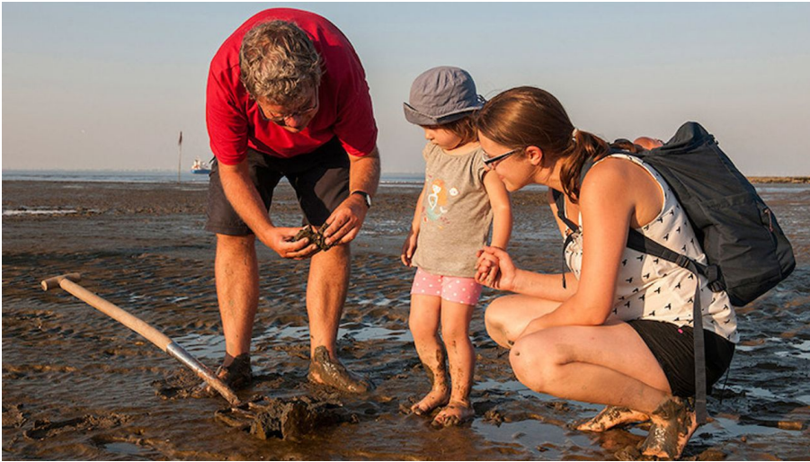
Kinder im Watt - Geführte Familien-Wattwanderung im Nordseebad Otterndorf