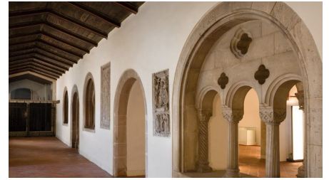
BLM_Hinter_Aegidien © Braunschweigesches Landesmuseum (3)_Ausschnitt.jpg - © Braunschweigesches Landesmuseum