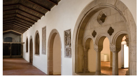
BLM_Hinter_Aegidien © Braunschweigesches Landesmuseum (3)_Ausschnitt.jpg - © Braunschweigesches Landesmuseum