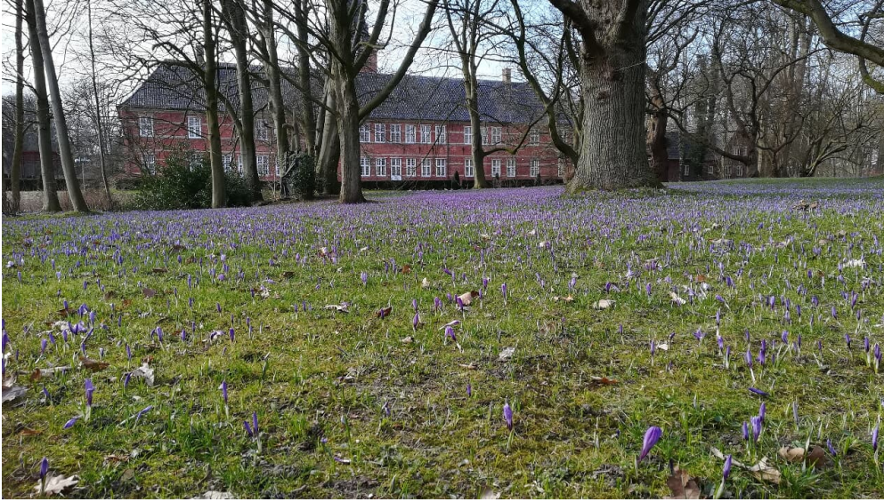
Krokusblu#te in Husum.jpg