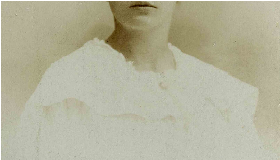
Fanny zu Reventlow.jpg