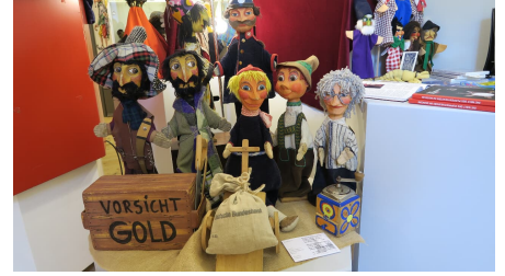
Pole Poppenspa#ler Museum.JPG