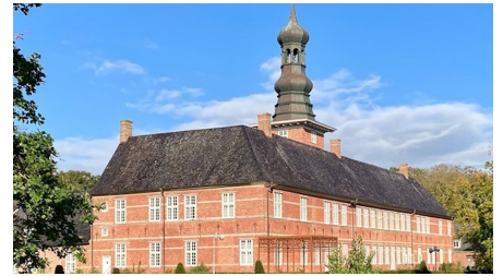
Schloss vor Husum.jpg