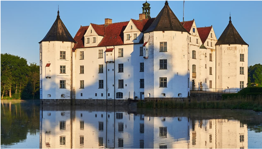
Schloss Glu#cksburg.jpg