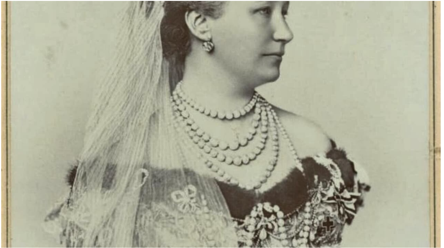
Kaiserin Auguste Viktoria.jpg