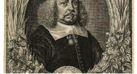
Friedrich III. (1597-1659) Herzog von Schleswig-Holstein-Gottorp.jpg -, Joachim von Sandrart, 1606-1688 (Künstler)