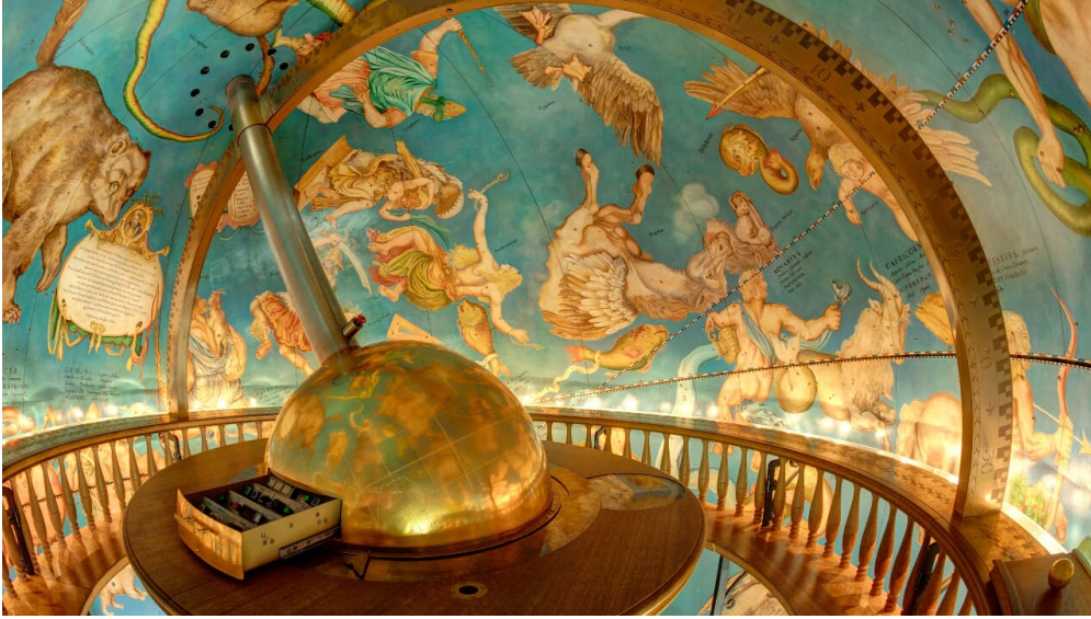
Gottorfer Globus.jpg