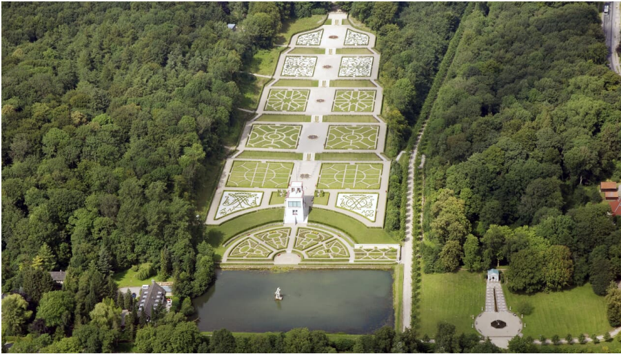
Barockgarten Schloss Gottorf.jpg