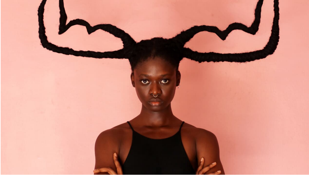
Ky, Laetitia_Empowerment Key Visual.JPG - © Laetitia_Empowerment Key Visual