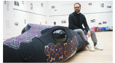
kunstmuseum-WOB-dino-steinhof.JPG - © Beate Ziehres für zeitORTE.de