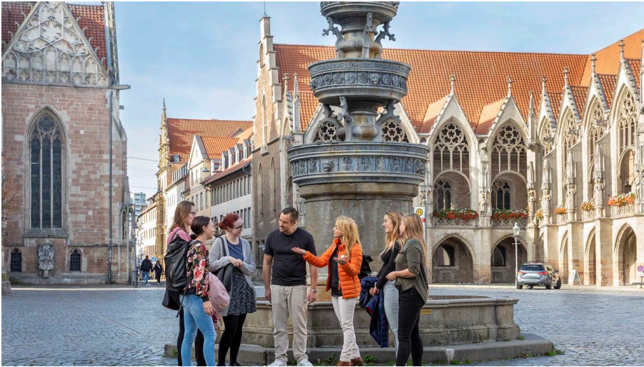
Stadtpaziergang mit Führung in Braunschweig