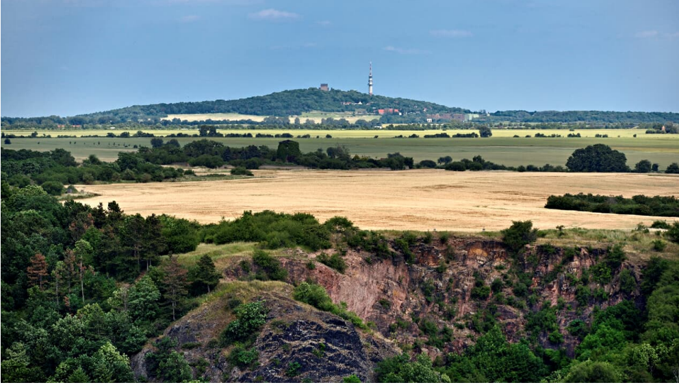
Bismarkturm von Wettin im nördlichen Saalekreis. Ausblick aus dem Bismarkturm bei Wettin.