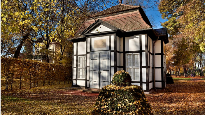
Kurpark von Bad Lauchstädt im südlichen Saalekreis im Herbst.