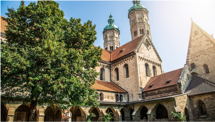
Naumburger Dom