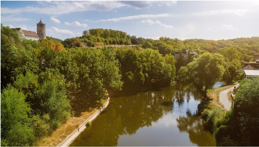
Dornburg-Camburg - © Transmedial