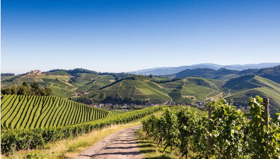
Panoramablick Durbach