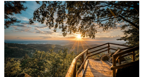
Bürstenstein mit Blick in die Rheinebene