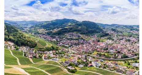
Blick über Kappelrodeck und Waldulm