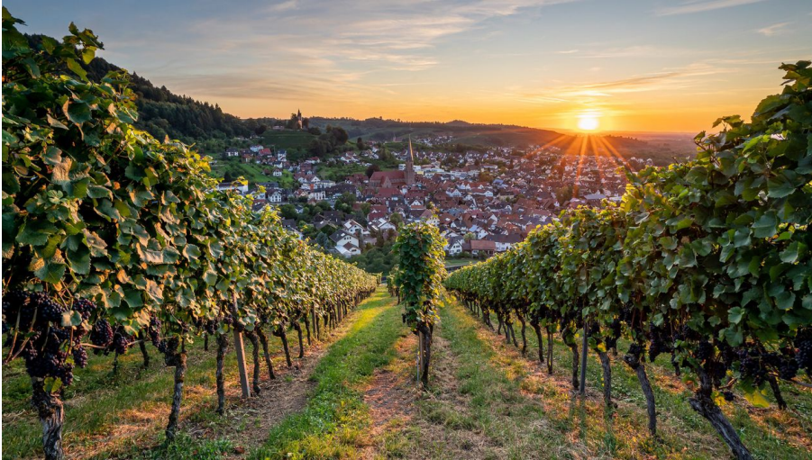
Blick auf Kappelrodeck