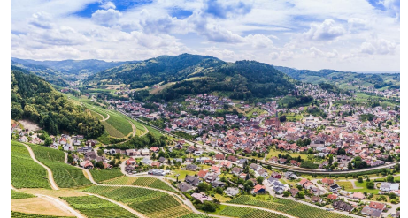
Blick über Kappelrodeck und Waldulm