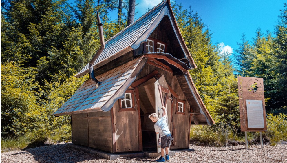
Hexentanzplatz auf dem Kappelrodecker Hexensteig

Winzerkellerbesichtigungen, geführte Wanderungen, spannende Kinderangebote, Schnapsproben und Brennereibesichtigungen sowie Weinfeste bieten dem Gast eine bunte Palette der Unterhaltung und erschließen ihm die traditionsreiche Weinbaugegend an der "Badischen Weinstraße".