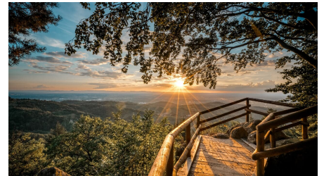
Bürstenstein mit Blick in die Rheinebene