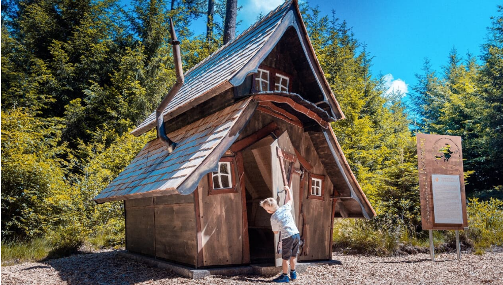
Hexentanzplatz auf dem Kappelrodecker Hexensteig

Winzerkellerbesichtigungen, geführte Wanderungen, spannende Kinderangebote, Schnapsproben und Brennereibesichtigungen sowie Weinfeste bieten dem Gast eine bunte Palette der Unterhaltung und erschließen ihm die traditionsreiche Weinbaugegend an der "Badischen Weinstraße".