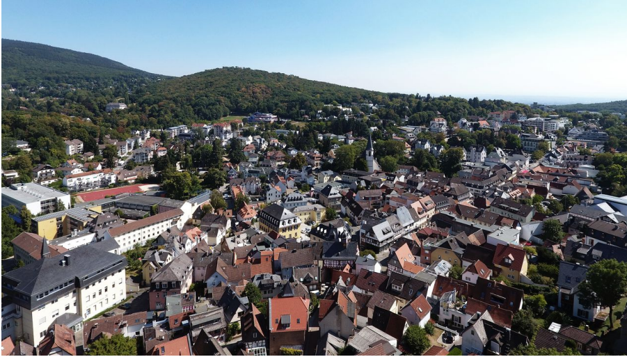
DCIM\101MEDIA\DJL_0463.JPG - © Heiko Rhode