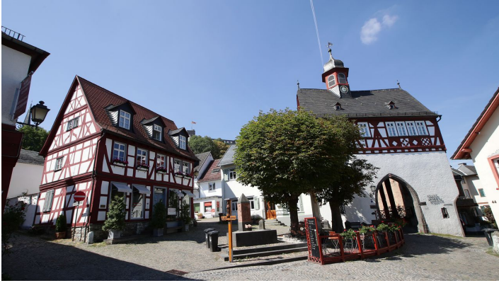
Koenigstein_160818_064.JPG - © Heiko Rhode