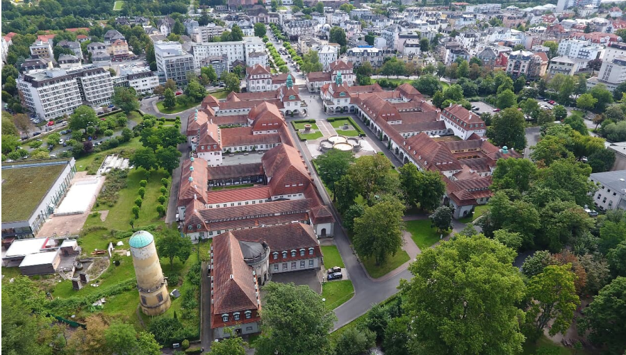
Bad Nauheim - Sprudelhof von oben