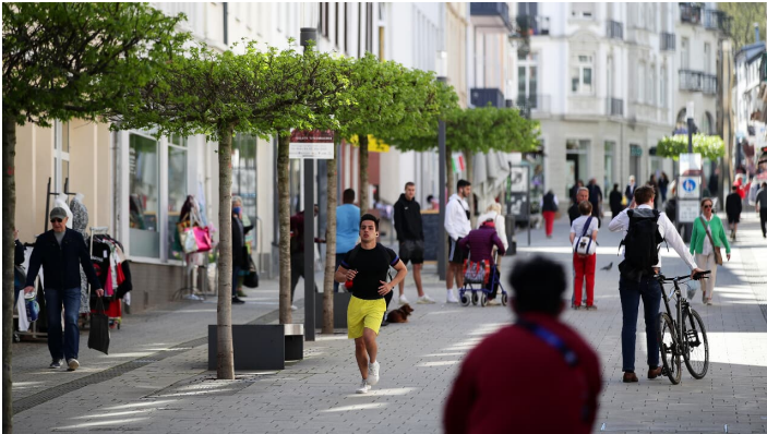
Bad_Nauheim_200420_34.JPG - © Heiko Rhode

Achtsamkeitstraining/-wandern, Gesundheitswandern, Trinkkur