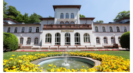
Bad_Soden_060717_54.JPG - © Heiko Rhode