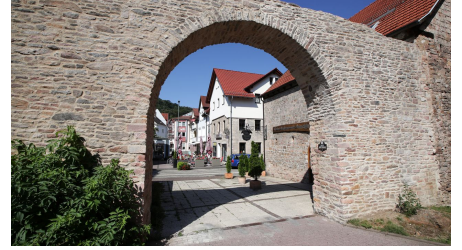
143HR - Bad Orb - Stadtmauer.JPG