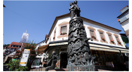
169HR - Bad Orb - Brunnen.JPG