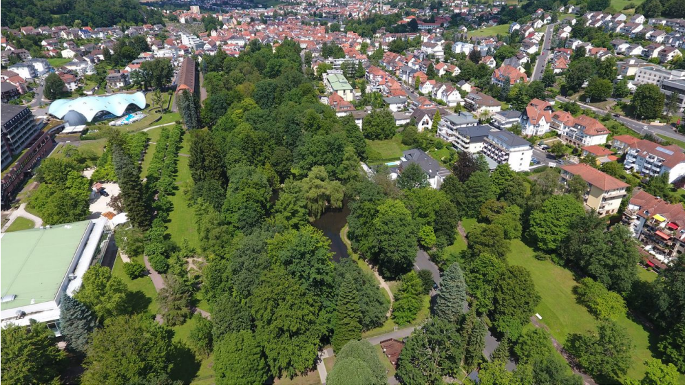
Bad Orb von oben