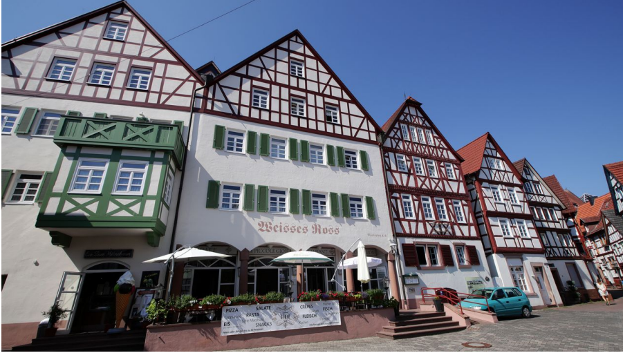
154HR - Bad Orb - Stadtansicht.JPG