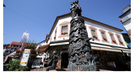
169HR - Bad Orb - Brunnen.JPG