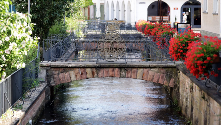
140HR - Bad Orb - Fluss Orb.JPG