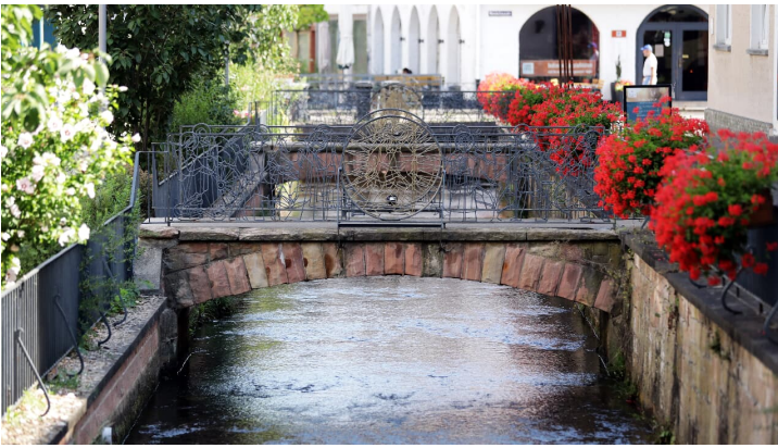
140HR - Bad Orb - Fluss Orb.JPG