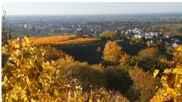
Blick auf Bühl