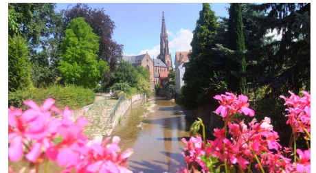
Pfarrkirche St. Peter & Paul