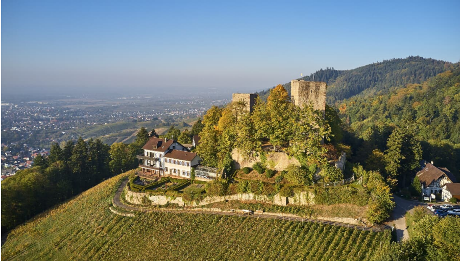
Burg Windeck